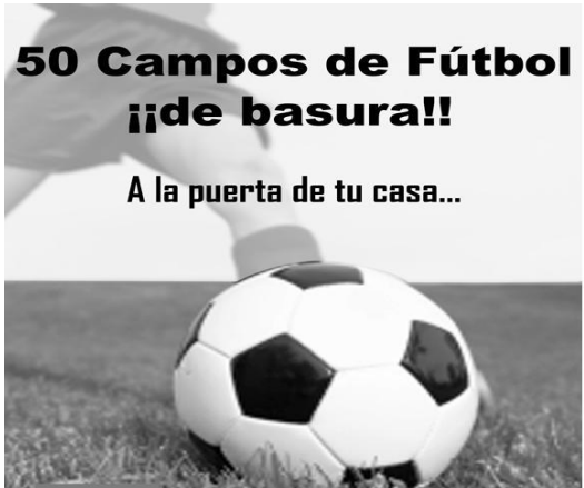
¡¡NO!! A la incineradora de Basuras de Loeches

MundoClip: Guardando el puesto de MundoClip, nos encontramos con una familia, y, es que MundoClip es una cooperativa familiar especializada en la fabricación de productos de artesanía, basadas en un elemento, el clip. El artesano de esta cooperativa, que es el padre de la familia, nos explicó que ya hacían clips gigantes que sirviesen como pisapapeles, clips en portabotellas... e incluso percheros "clip" y aún hay muchos más proyectos y bocetos de diseños para vivir en un auténtico Mundo Clip. Más info: http://mundoclip.es/wordpress/ Coordinadora de Solidaridad 0,7 de Coslada. Esta entidad, cuenta con una tienda de Comercio Justo donde puedes comprar productos en los que los salarios y las condiciones de los trabajadores son dignos, no hay explotación infantil sigue unos criterios de respeto al medio ambiente... La tienda, se encuentra regentada por voluntari@s y abierta de Lunes a Jueves de 18:00 a 20:00. Más info: www.coordinadora07.es