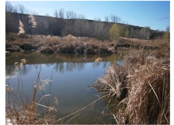
Laguna principal del parque en Marzo

La situación ha llegado a tal punto, que, por primera vez en los más de 20 años de existencia del humedal, se ha desecado completamente, gran parte de la vegetación se está secando, y, los animales están empezando a morir.