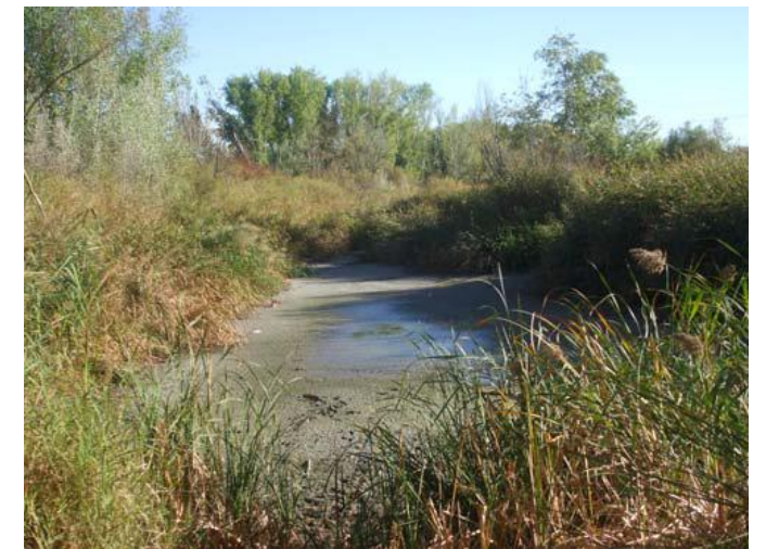
Laguna principal del parque en Septiembre.

La situación ha llegado a tal punto, que, por primera vez en los más de 20 años de existencia del humedal, se ha desecado completamente, gran parte de la vegetación se está secando, y, los animales están empezando a morir.