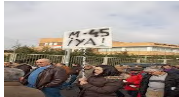
Mobilizaciones por la M-45