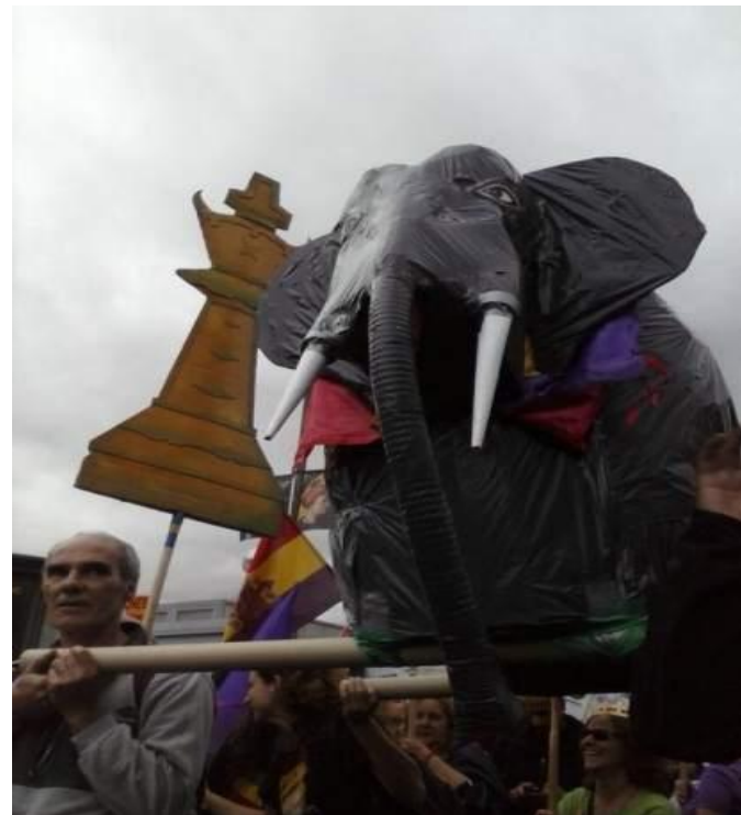
Imagen de la manifestación “Jaque al rey”.