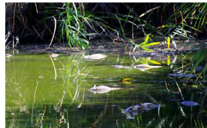
Primeros peces muertos

La tragedia ambiental de "Las islillas", comienza en julio, cuando, después de la rehabilitación de la zona por la Consejería de Medio Ambiente (y el correspondiente acto de propaganda institucional con visita del consejero de Medio Ambiente, seguido de su comitiva para aparecer en unas cuantas fotos y mostrar el profundo compromiso de la consejería con el parque), se abandona el parque, que, por falta de mantenimiento, y, por unas obras en unos cauces de riego cercano que impiden la permeabilización del agua, por los mismos, una de las principales fuentes de agua de las que se servía el humedal, comienza a desecarse.