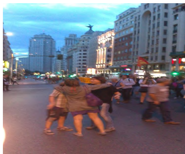
Instantánea tomada tras una manifestación

Un dogma cristiano-ortodoxo ha caído sobre nuestras cabezas, un talibanismo cristiano más acorde con los tiempos de los requetos (fanáticos-católicos ) que el anterior régimen se valía para castigar aquel pobre desgraciado que no protara un crucifijo... La sociedad Española lleva aires de libertad en las venas, no podrán con “barrotes y cadenas”. Sabemos luchar, sabemos morir por un ideal justo, honesto, y unos principios de libertad, que nuestros padres y abuelos consiguieron con su propia sangre. No vamos a permitir que conviertan a España en Afganistán, Pakistán o Corea del Norte